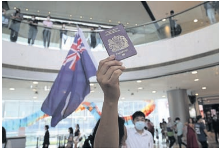
In this Friday, May 29, 2020 file photo, protesters hold a British National (Overseas) passport and Hong Kong colonial flag in a shopping mall during a protest against China's national security legislation for the city, in Hong Kong.

Liu denied Uighurs were being mistreated and posted screen grabs that challenged, among other things, whether the prisoners were kneeling or sitting on the ground. He described "so-called victims" of human rights violations as being either separatists